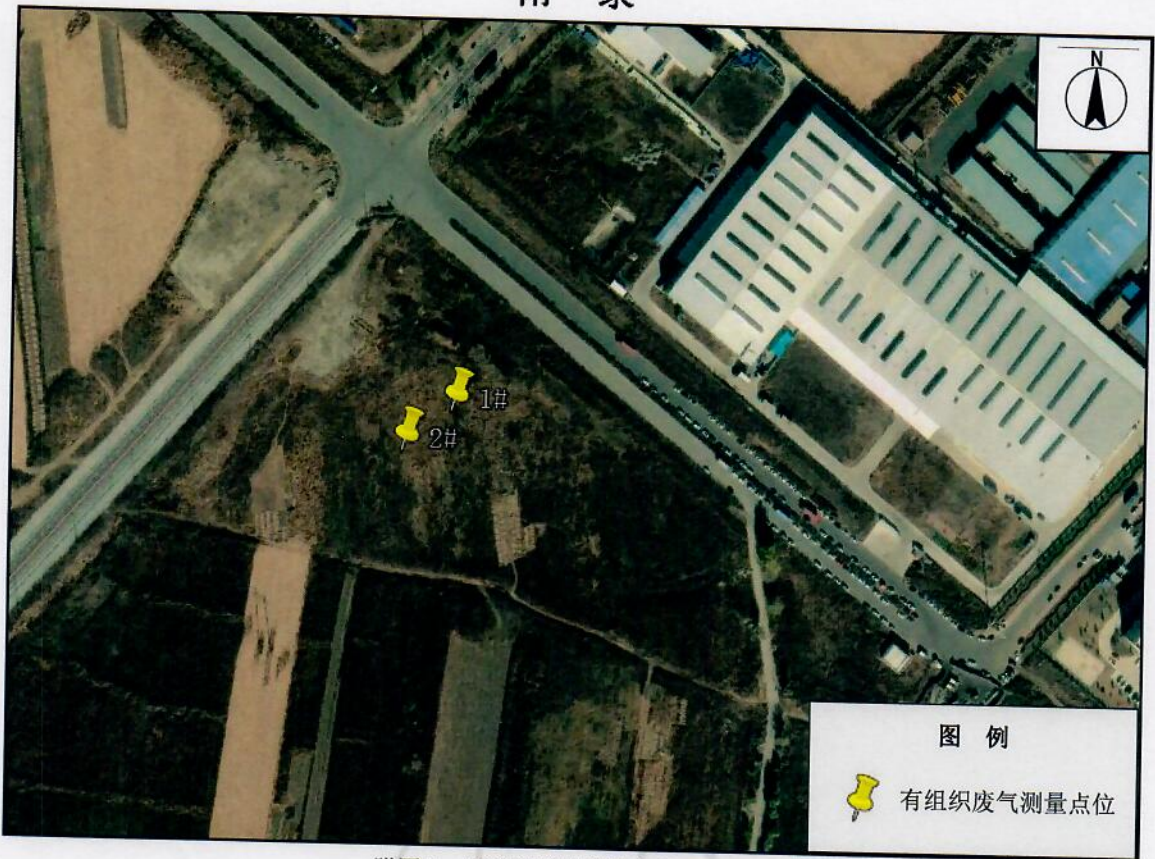
附图1 有组织废气测量点位示意图